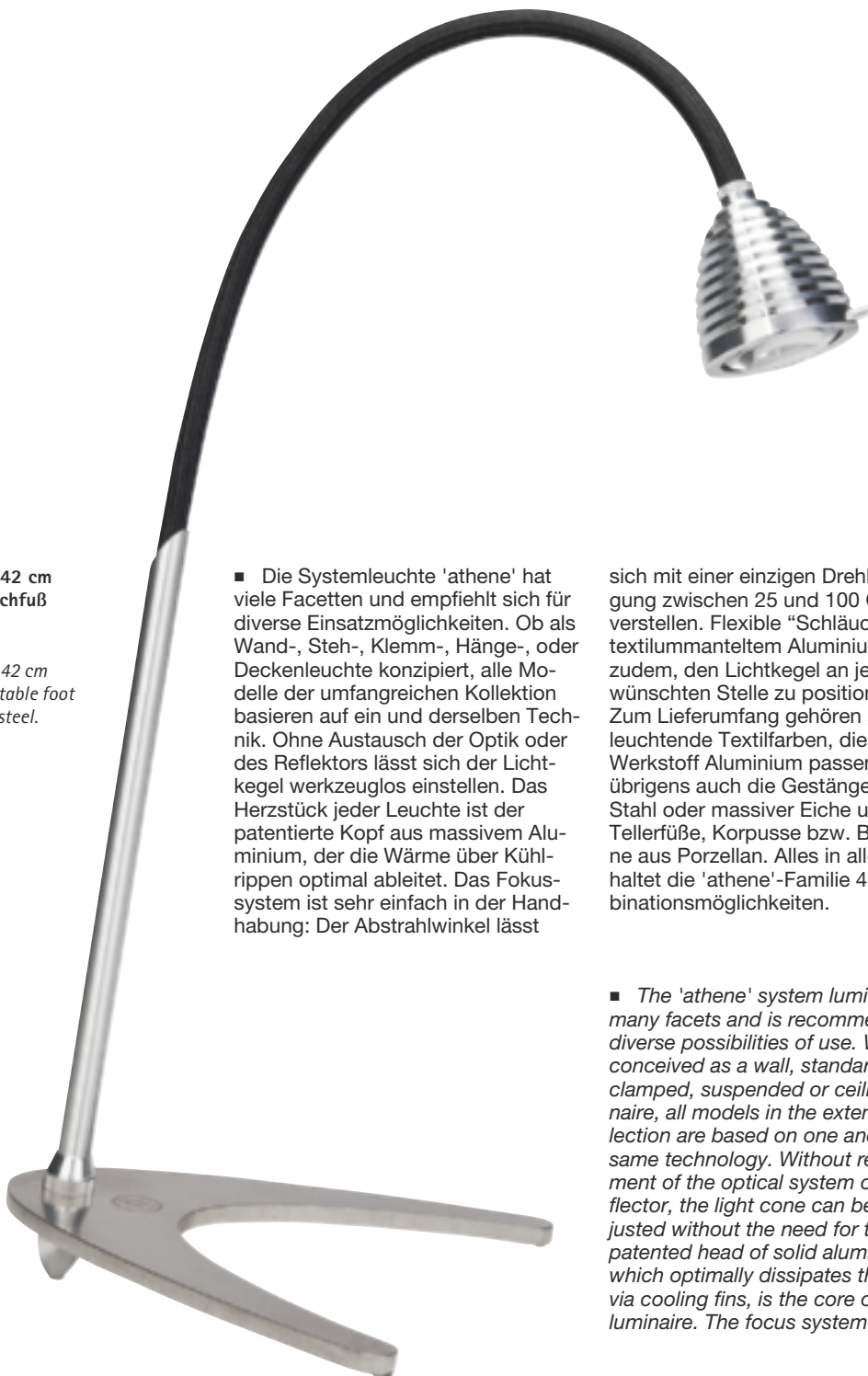
Table lamp with a 42 cm flexible shaft and table foot made of stainless steel.

■ Die Systemleuchte 'athene' hat viele Facetten und empfiehlt sich für diverse Einsatzmöglichkeiten. Ob als Wand-, Steh-, Klemm-, Hänge-, oder Deckenleuchte konzipiert, alle Modelle der umfangreichen Kollektion basieren auf ein und derselben Technik. Ohne Austausch der Optik oder des Reflektors lässt sich der Lichtkegel werkzeuglos einstellen. Das Herzstück jeder Leuchte ist der patentierte Kopf aus massivem Aluminium, der die Wärme über Kühlrippen optimal ableitet. Das Fokussystem ist sehr einfach in der Handhabung: Der Abstrahlwinkel lässt