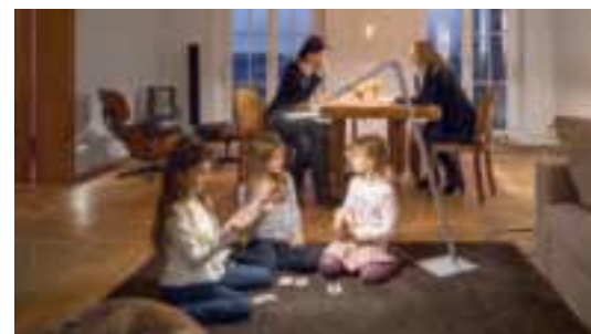
SCHÖNER SCHEIN MIT LED-LAMPEN