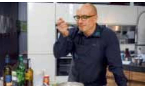
WENN MÄNNER DIE KÜCHE REGIEREN