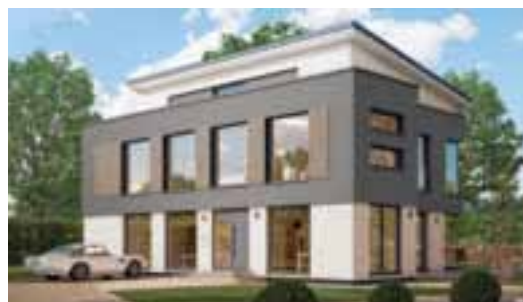
PLUS-ENERGIEHAUS: ALLE VORTEILE